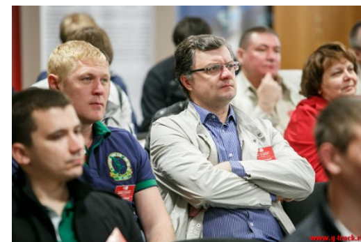
Внимательное отношение к истории известных брендов

Каждый представитель получил возможность рассказать историю своего бренда, напрямую обратившись к участникам рынка.