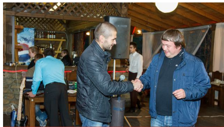
Участник партнерской сети G-TRUCK поблагодарил представителя компании Schaeffler Group за полученные в прошлом году знания