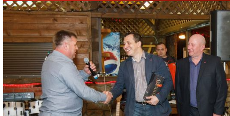
Участник партнерской сети G-TRUCK выразил признательность организаторам форума за полученные впечатления и знания