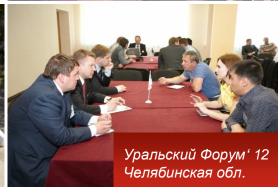
Уральский Форум' 12 Челябинская обл.

Важнейшей составляющей мероприятия стали презентации и круглые столы, проводимые производителями запасных частей фирм Vibracoustic, ROSTAR, BorgWarner BERU Systems, Schaeffler Group, WABCO