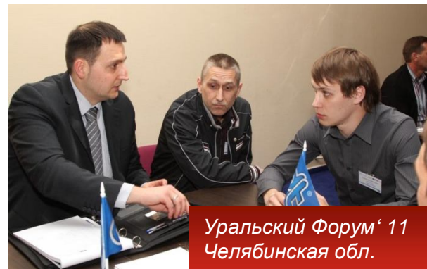
Уральский Форум '11 Челябинская обл.

В организации форума приняли участие представители шести крупных производителей запчастей из Европы: Contitech AG, Diesel Technic Schaeffler Group, Febi, Hengst, WABCO