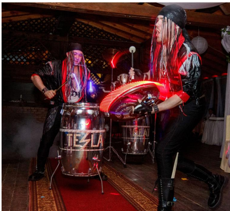
Яркое выступление группы барабанщиков "Tesla beat" было встречено аплодисментами