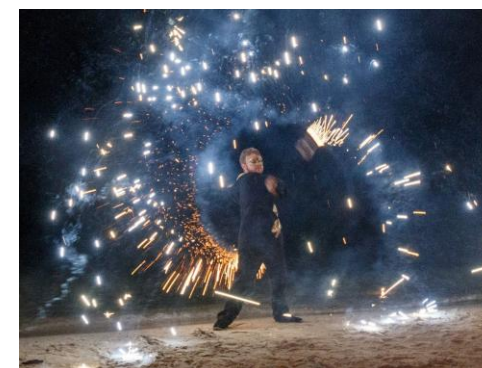
Красочный салют завершил вечер