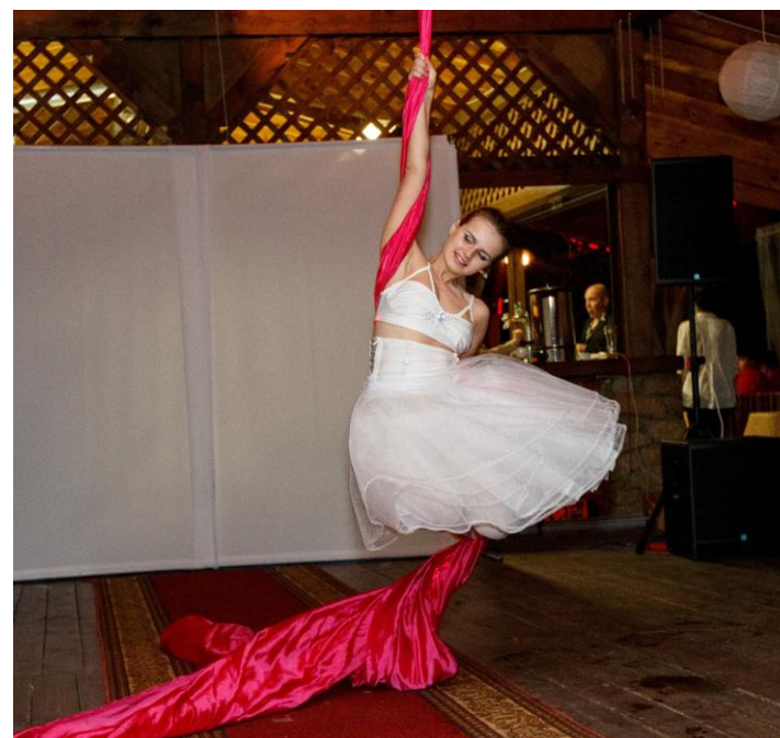
Зажигательное выступление танцовщицы украсило вечер