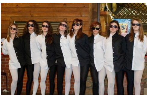
Черно-белый танец от девушек-моделей