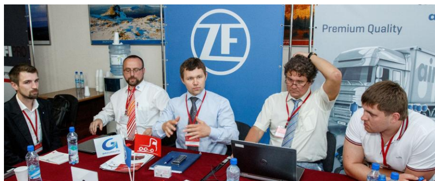
Участники IV Уральского межрегионального форума задают вопросы представителям компании ZF