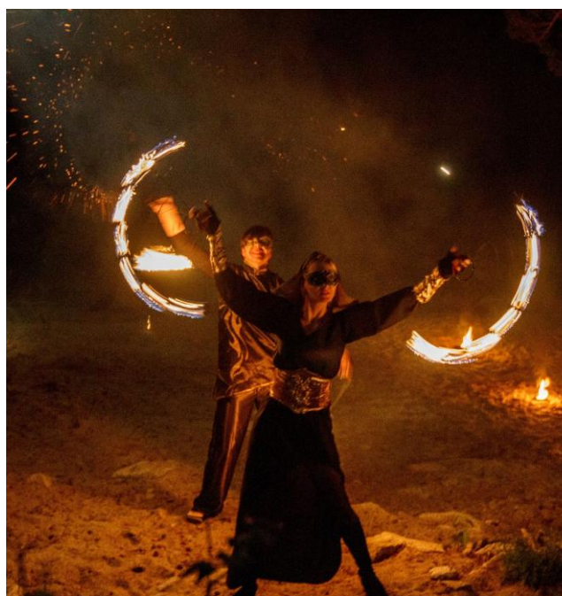
Завораживающее фэйер-шоу на берегу озера