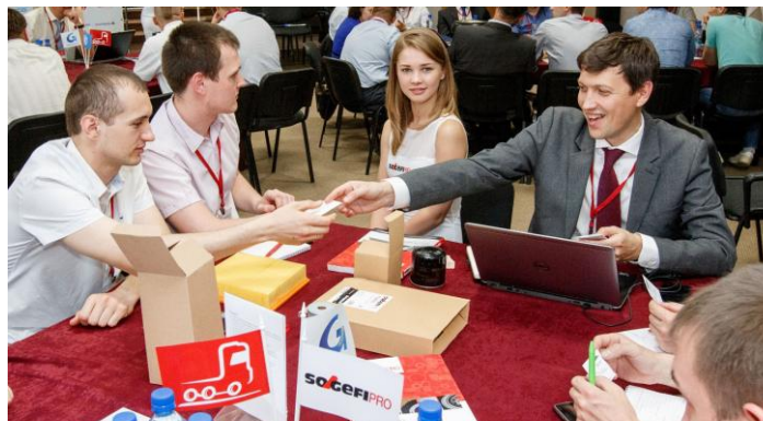
Представитель компании SOGEFI GROUP демонстрирует участникам форума продукцию компании