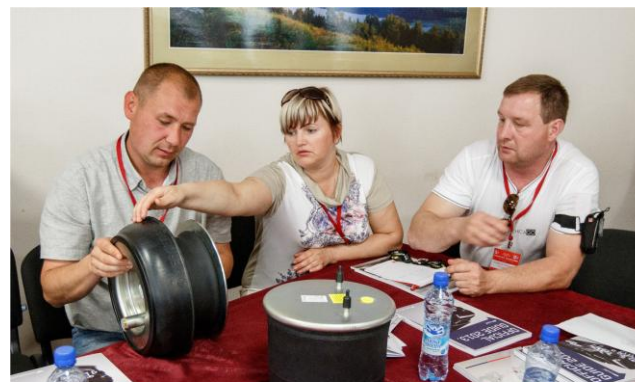
Участники IV Уральского межрегионального форума первыми увидели новые пневморессоры компании VIBRACOUSTIC