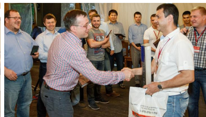
Представители участника партнерской сети G-TRUCK КАЗАНЬ-ШИНТОРГ подарили подарок сотрудникам компании CONTITECH