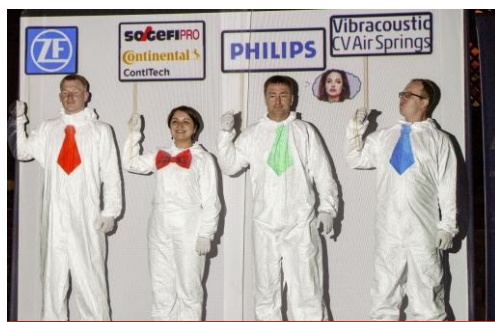
Сценка “Особенности уральского гостепреимства”