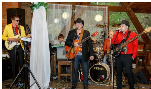
Группа “Братья Енотовы”