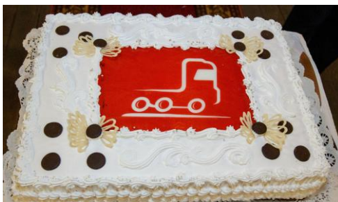
Торт G-TRUCK в подарок участникам форума